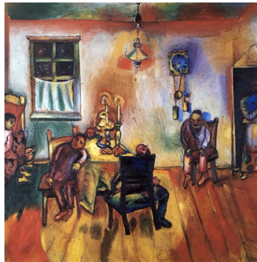
Detail Marc Chagall, Sabbath , 1909

Zondag is de dag waarop de dingen weer een beetje goed komen, de dag waarop wij ons weer mens voelen. Het is een dag om stil te worden, en weer tot onszelf te komen. Het is de dag waarop we op adem kunnen komen na een week werken, én de ander op adem laten komen. Het is een