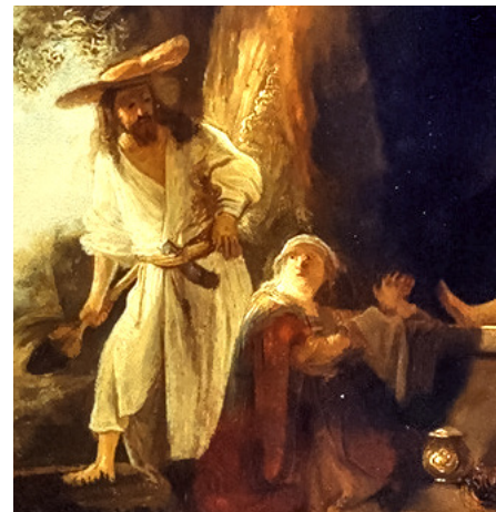
Detail van het schilderij "De opgestane Christus verschijnt aan Maria Magdalena" (1638) van Rembrandt van Rijn (1606-1669)

Levinas brengt nog een ander idee naar boven: het “ik” is geroepen door de ander. Dit wil zeggen dat wij de ander niet kiezen; neen, de ander kiest ons. In plaats dat wij tussen al onze medemens een keuze maken van de naaste die wij willen helpen, is het de naaste die ons uitkiest. Men kan zichzelf niet uitnodigen; ik word door de ander uitgenodigd om mij in te zetten. Maar de