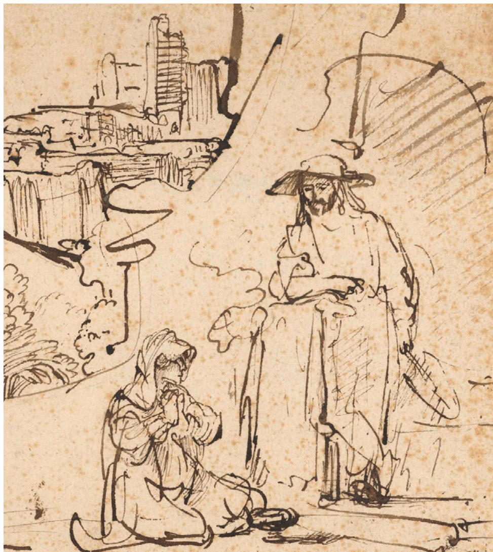
Christus verschijnt als tuinman aan Maria Magdalena: (Noli me tangere) Ferdinand Bol ca 1640 https://www.rijksmuseum.nl/nl/collectie/RP-T-1930-29